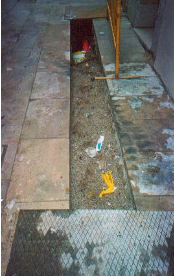
Fotografia 1: Detall de la rasa en el seu tram del carrer de Manresa, un cop tapada.