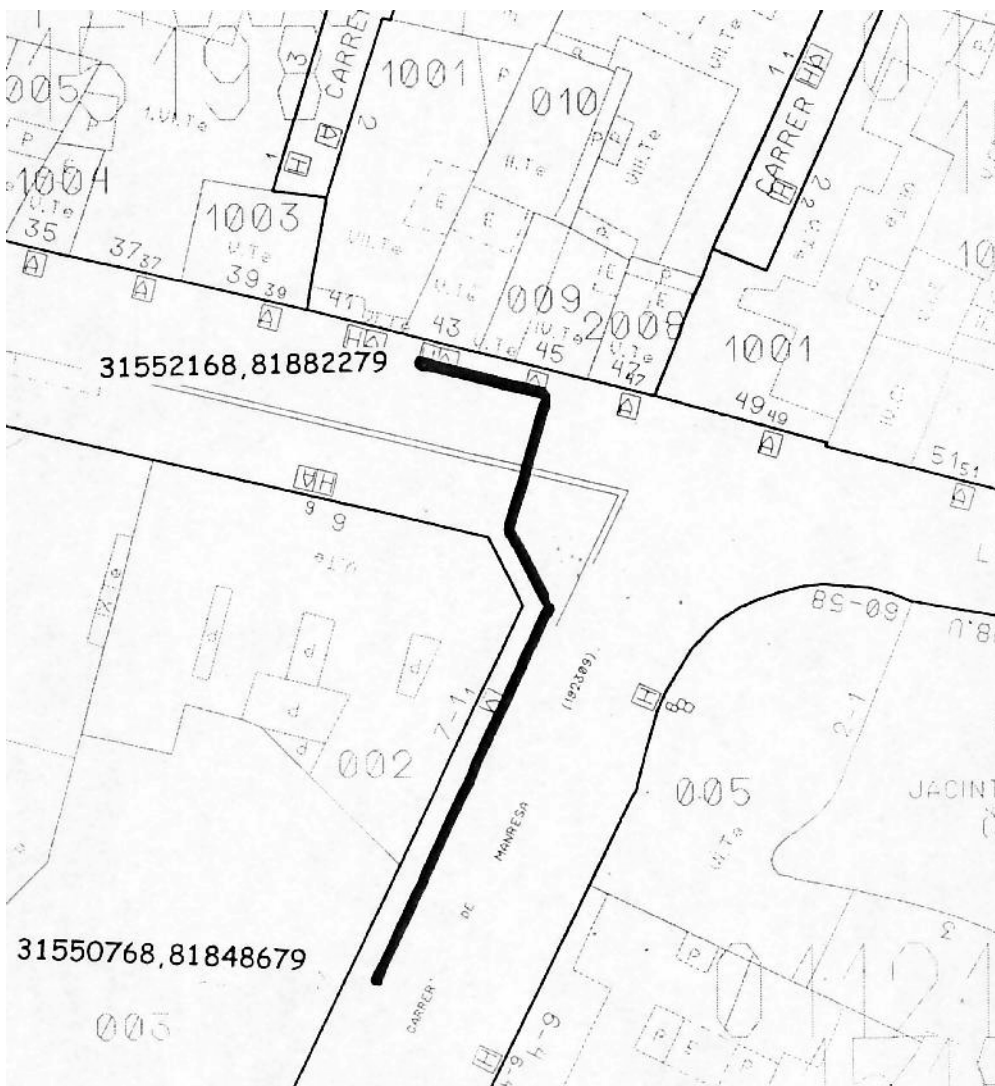
Fig.2: Traçat de la rasa del carrer d' Argenteria i del carrer de Manresa.