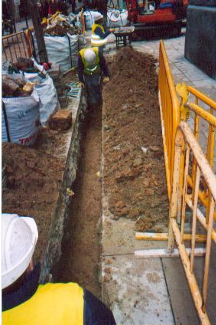
Fotografia 2: Detall de la rasa en el tram del carrer d' Argenteria.