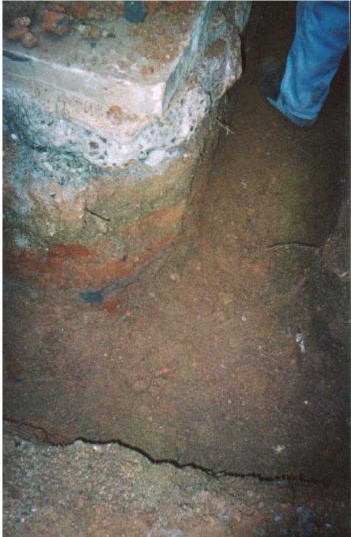
Fotografia 4: Detall de la secció de la rasa 100 en el tram del carrer d' Argenteria.