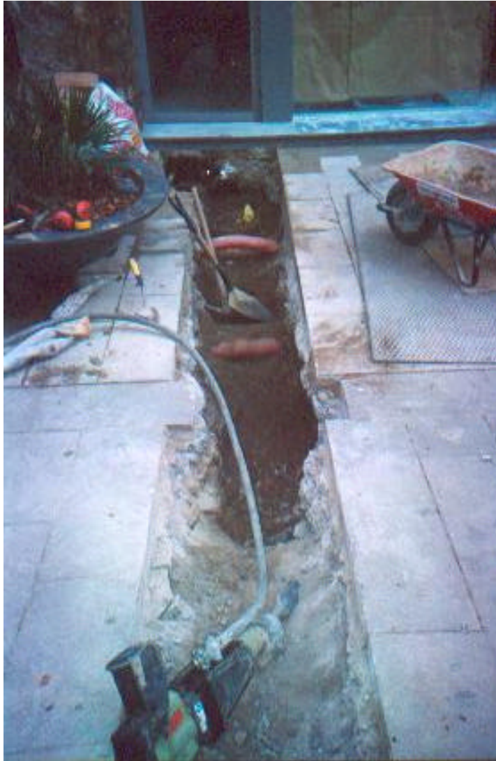
Fotografia 3: Detall de la rasa en el tram que creua el carrer d'Argenteria.